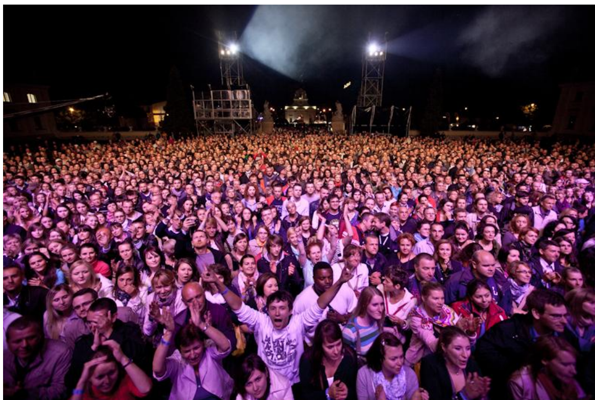
Tłumy podczas Pozytywne Wibracje Festival 2011

Pozytywne Wibracje Festival, pomimo krótkiego stażu, zdążył już zaznaczyć swoją obecność na mapie letnich polskich festiwali. Doskonale nagłośnienie, bajeczne oświetlenie, szalejące tłumy, pozytywna atmosfera, a także urzekająca sceneria dziedzińca zabytkowego Pałacu Branickich, to tylko niektóre zalety wydarzenia, wskazywane przez zadowolonych uczestników festiwalu. Władzom Białegostoku udało się zrealizować główny cel – stworzyć wydarzenie kulturalne o niepowtarzalnym charakterze, na najwyższym europejskim poziomie. Potwierdzają to dane z „Raportu wielkich miast Polski” PwC, według którego właśnie za sprawą organizacji Pozytywne Wibracje Festival, Białystok w końcu zaistniał na mapie masowych imprez kulturalnych w Polsce.